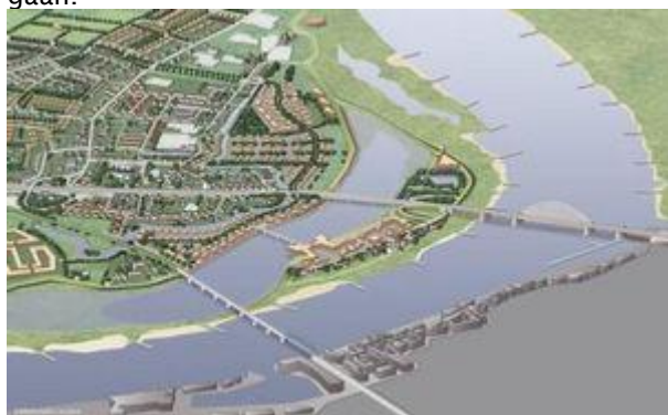
Zo komt de nevengeul bij Lent eruit te zien.

De gemeente Nijmegen voert de regie over dit project, dat onderdeel is van het programma Ruimte voor de Rivier van het rijk. Den Haag zorgt ook voor de financiering. Formeel kunnen de andere zeven partijen en bedrijven (ook buitenlandse) die ingeschreven hadden op dit project, nog in beroep gaan tegen de beslissing van de gemeente. Medio juli wordt daarom pas definitief bekend of Dura Vermeer en Ploegam in Lent echt aan de slag mogen gaan.